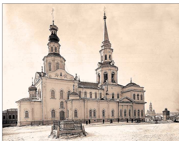
Каменный Екатеринбургский собор

Богоявленская со временем ветшала. Увы, век дерева — короткий. Разрушить её не стали. Каменный Богоявленский собор возвели рядом, и случилось это в 1771 году. Поговаривали, что архитектором был один из учеников Доменико Трезини, первого архитектора Санкт-Петербурга. И не зря — ведь внешне Богоявленская церковь напоминает Петропавловский собор в северной столице, самый знаменитый труд Трезини. Чуть с меньшим размахом, конечно. В длину здание было 55,5 ме-