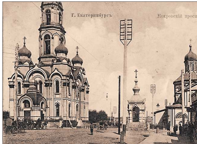
Псковский проспект. Большой и Малый Златоуст. Большой Златоуст был самым большим зданием в городе. Кстати, изначально его строили как колокольню для более величественного храма. Но на масштабный проект не хватило средств, и колокольню освятили как храм. Он был снесён в 1930-м и выстроен заново в 2006-2012 годах. Фото 1910 года

тра, в ширину 25,6, в высоту — 40,5 метра, а высота пятиярусной колокольни превышала 66 метров. Около сотни лет (до постройки Большого Златоуста) это было самое большое здание в городе. Кстати, говорят, что когда в 1930 году его снесли, в подвалах остались захоронения первосвященников и некоторые предметы церковной утвари. В том числе не дешёвые... Сейчас на этом месте — памятник Ленину. Некоторое время деревянная и каменная Богоя-