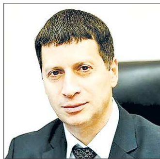
Леонид РАПОПОРТ, министр физической культуры, спорта и молодежной политики Свердловской области

—Для меня главным событием стал тот факт, что впервые в истории Урала (я думаю, что впервые и в истории современной России) летний Гран-при по прыжкам на лыжах с трамплина проводится в Свердловской области, городе Нижнем Тагиле. Это действительно невероятно: лыжники-зимники летом прыгают с трамплина. Отмечу, что по своему уровню Гран-при — третье по статусу состязание: оно уступает только Олимпийским играм и чемпионату мира.