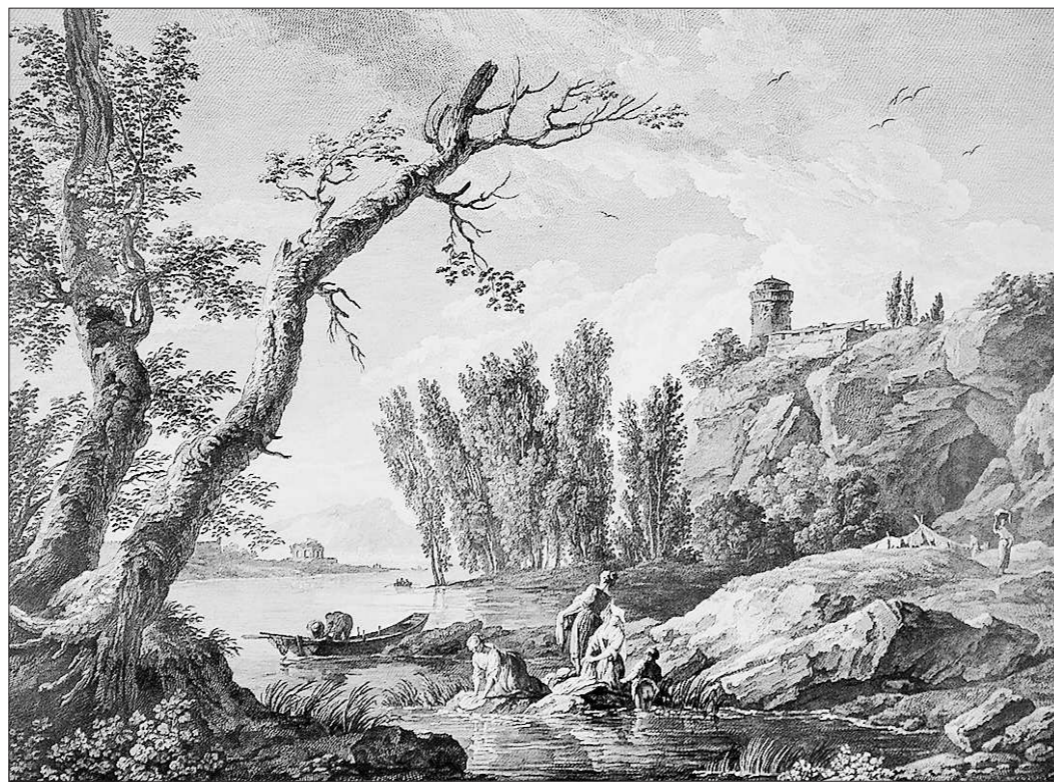
Жак Альяме. Трудлюбивые итальянки