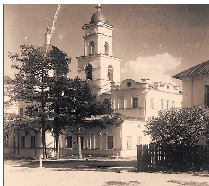
Каменная Успенская церковь — старейшая на территории Ново-Тихвинского монастыря. Фото предположительно 1910 года

Первая каменная церковь. Екатеринбургский собор. В 1734-м, по инициативе де Геннина, на Торговой площади города (ныне — площадь 1905 года) стали