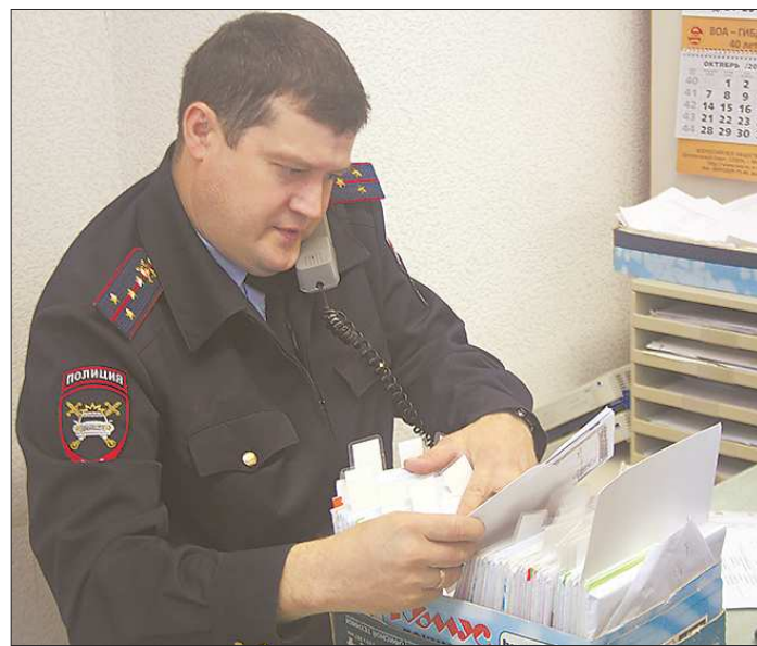
ПРЕСС-СЛУЖБА УПРАВЛЕНИЯ ПЛЕДТ ГУ МВД РОССИИ

Как видим, нам с «мобильным учителем», как ни интересен этот проект, пока не по пути.