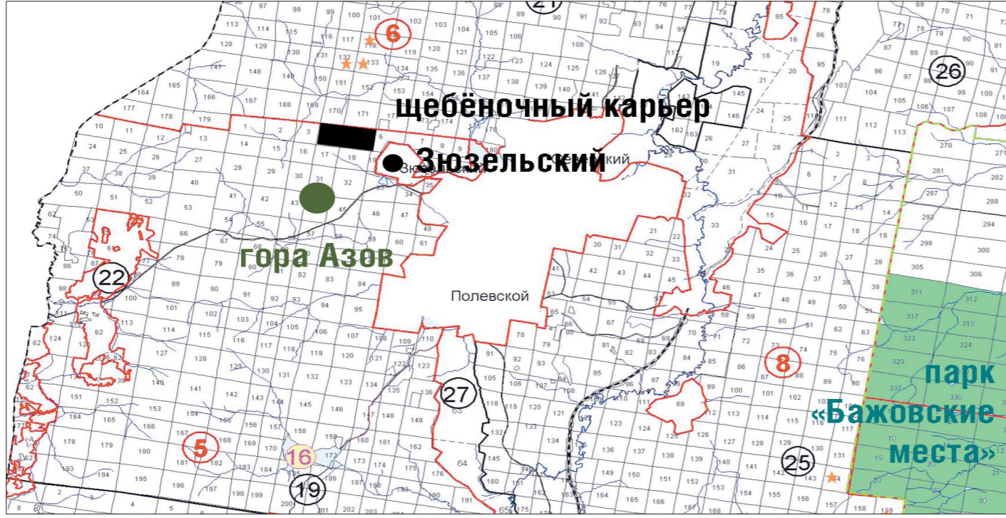
На карте-схеме видно: парку «Бажовские места» карьер не страшен, а посёлок Зюзельский — его ближайший сосед