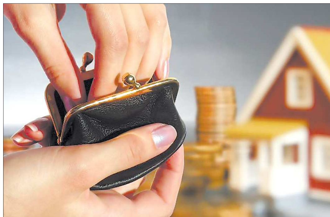
За год количество рублёвых миллиардеров, продекларировавших свои доходы, увеличилось в области на 50 процентов

Материалы о квитанциях на оплату жилищно-коммунальных услуг выходят в «Областной газете» каждую среду и субботу