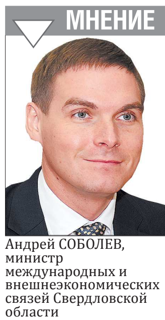
Андрей СОБОЛЕВ, министр международных и внешнеэкономических связей Свердловской области