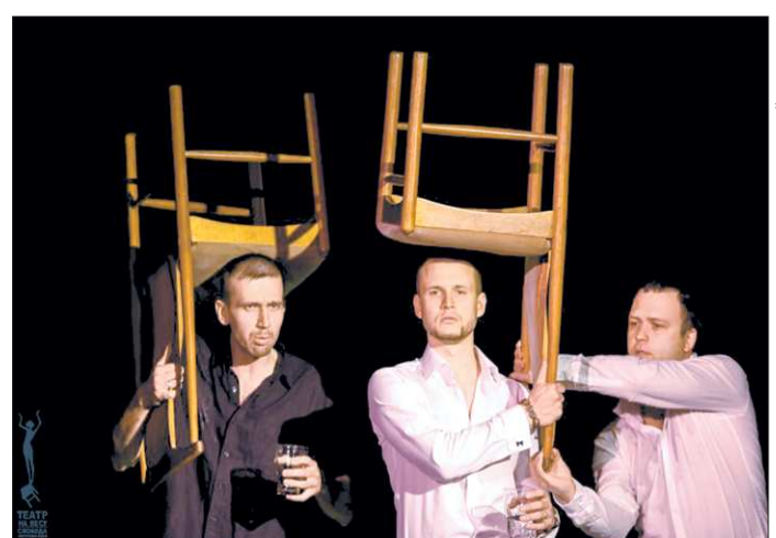
В Городских зрелищных кассах нам подтвердили, что разорвали договор с театром из-за жалоб зрителей. Так что таких билетов теперь уже не увидать. Не все оказались готовы к неожиданностям, которые могут быть на сцене...