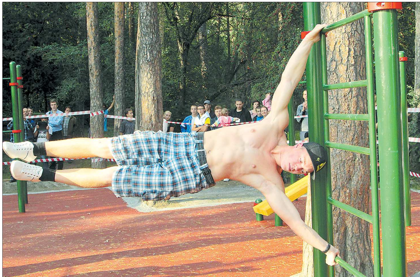
Воркаут позволяет почувствовать себя профессиональным гимнастом. Или суперменом — кому как больше нравится

Однако в интернет-пространстве особо не развернешься, а для упражнений нужна не только просторная, но и оборудованная площадка. Впрочем, снаряды довольно-таки бесхитростны: заниматься можно на оставшихся с советских времён турниках и брусьях, а порой достаточно просто-напросто твёрдой почвы под ногами. Но специальные площадки, как ни крути,