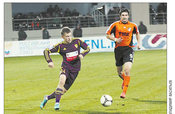
В кубковых матчах прошлого сезона екатеринбургцы дошли до 1/16 финала, проиграв затем махачкалскому «Анжи»