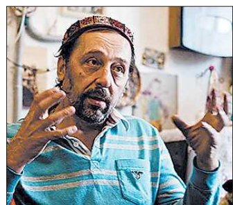
Николай Коляда: «Я пришёл с миром»