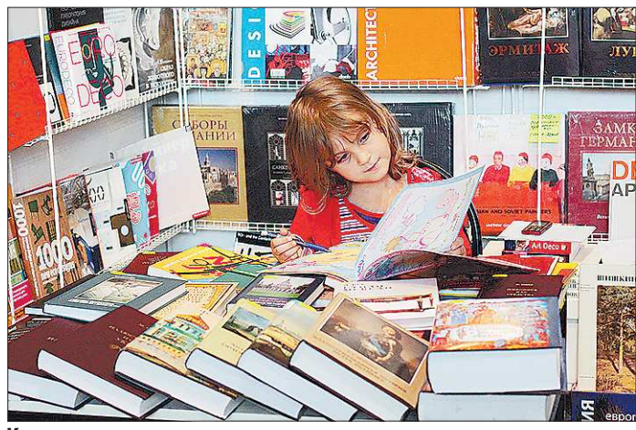
К счастью, дети не знают взрослых «книжных вопросов»