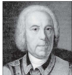
Настоящая фамилия де Геннина — Геннинг (Hennipg). А аристократическую приставку «де» он использовал для самопиара: дворянником он не был

Отношения отцов-основателей были далеко не дружественными. А как же иначе — Василий Татищев должен был быть единственным основателем города и уже в 1721 году начал строительство завода. Но у него возник конфликт с Демидовыми — те обвинили Василия Никитича в финансовых махинациях, взяточничестве и казнокрадстве. Василий Никитич даже был под следствием, но обвинения потом сняли. Пётр I не стал отстранять Татищева с должности, а направиł в строящийся город де Геннина, поручив ему приглядывать за строительством. Поэтому, разумеется, они друг друга, мягко говоря, недолюбливали. Хотя де Геннин, разобравшись в деле, признал, что Татищев во всём поступал справедливо.