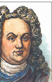
Татищев является основателем не только Екатеринбургa, но также Перми и Тольятти (Старопольна-Волге)

Татищев был невысокого роста, а рост де Геннина, напротив, превышал 180 сантиметров. А судя по памятнику, рост у них был одинаковым