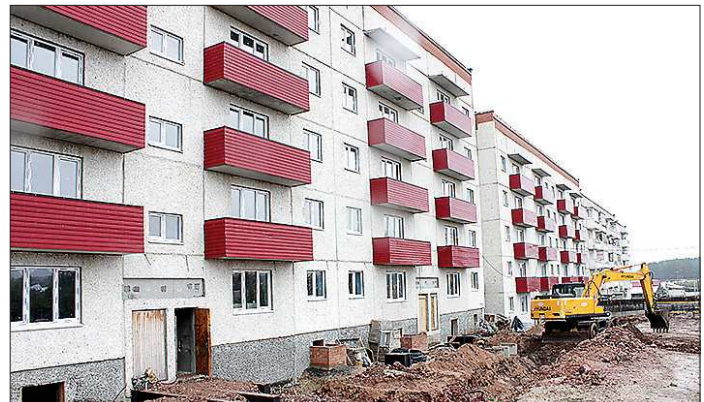
Многоквартирный дом в Североуральске завершён на 90 процентов и запланирован к сдаче в этом году

Планируется, что жильё здесь получат бюджетники, ветераны боевых действий, инвалиды, а часть квартир отдадут молодым врачам. Другой долгострой – новый корпус центральной городской больницы. Его возведение началось в 1989 году, но было остановлено. Лишь в 2013 году региональным властям удалось возобновить стройку. По словам Дениса Паслера, перед застройщиком поставлена задача: завершить объект до конца года. В этом году на достройку первого корпуса больницы из областного бюджета направлено около 60 миллионов рублей. В следующем году будет подготовлена проектно-сметная документация на строительство второго корпуса, где планируется разместить поликлинику и диагностический центр.