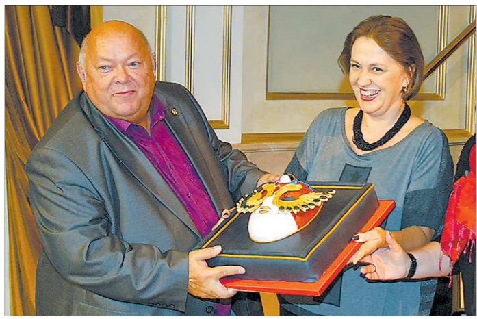
Театру-рекордсмену области по «Золотым маскам» даже торт преподнесли со значением