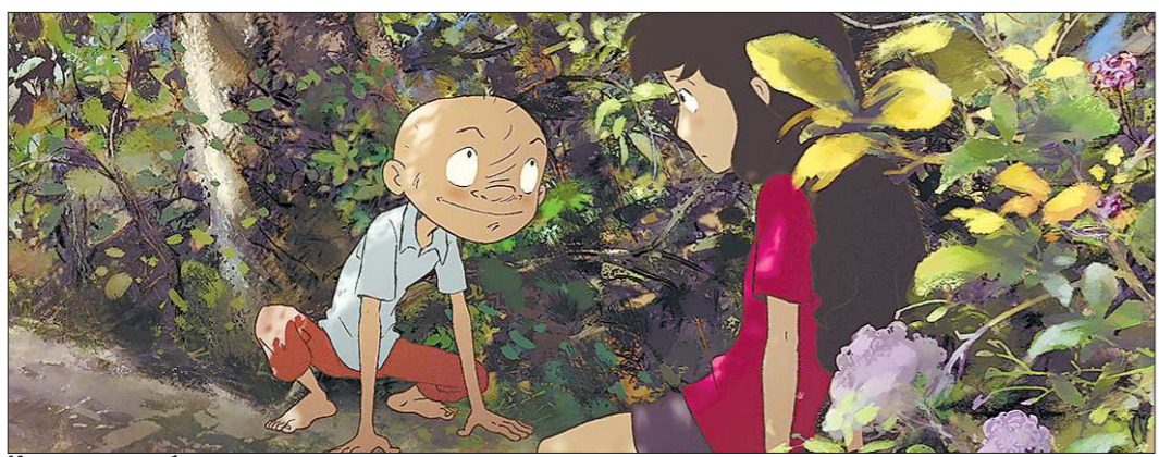
История о любви сына к отцу рассказана красивым языком, понятным даже самым юным зрителям