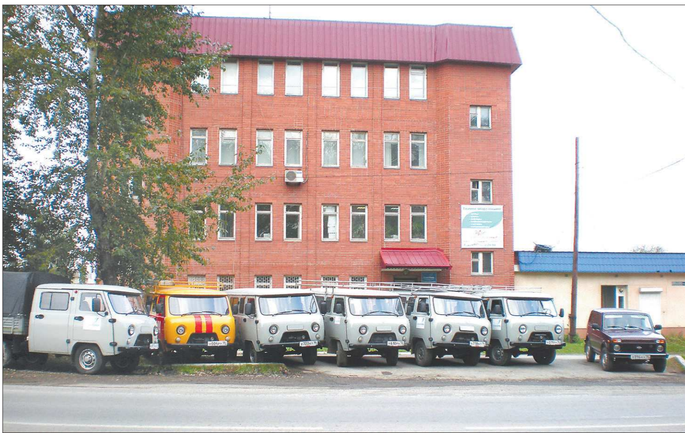
Эксплуатационная служба ГУП СО «Газовые сети» на территории Невьянского городского округа укомплектована оборудованием, материалами, квалифицированными кадрами. На линейке готовности — специализированный транспорт