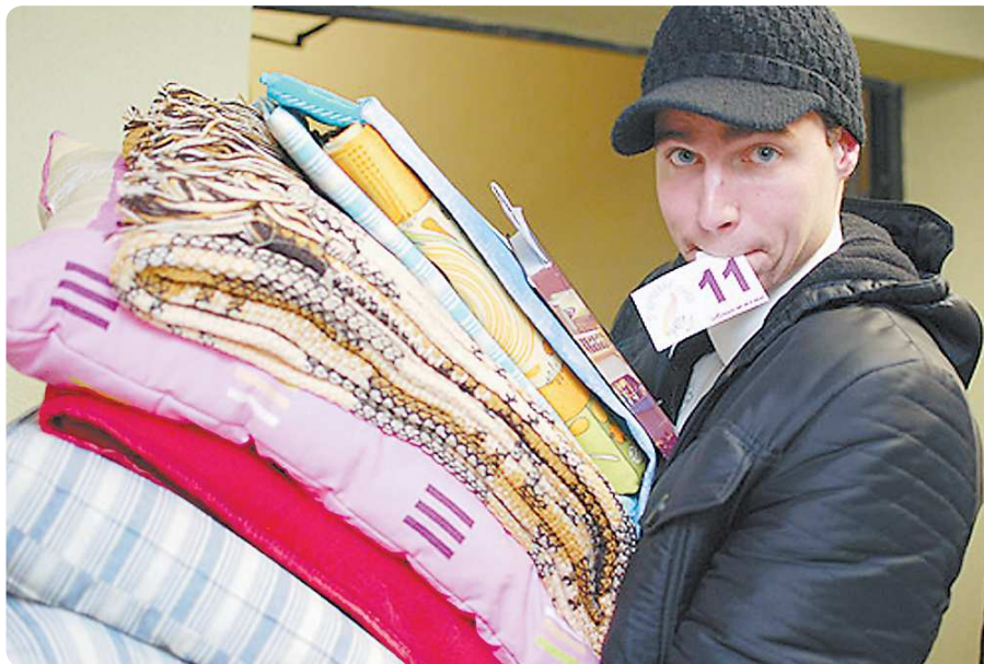
В общежитии нужно быть готовым к тому, что в новом учебном году тебя попросят перебраться с вещами в другую комнату

—Существует система выговоров. Максимум – два. За первым следует предупреждение. Например, назначаются часы отработки – на уборку территории, покраску стен. За вторым выговором уже следует выселение. Выговор можно получить за нарушение правил проживания, о которых студентам рассказывают при заселении. Например, за нарушение санитарных норм – беспорядок