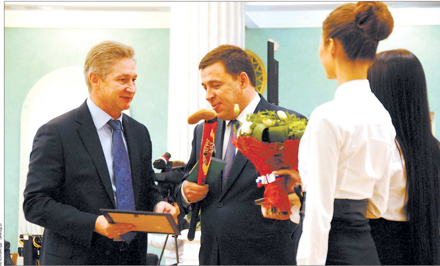
Губернатор не только вручал подарки, но и получал их