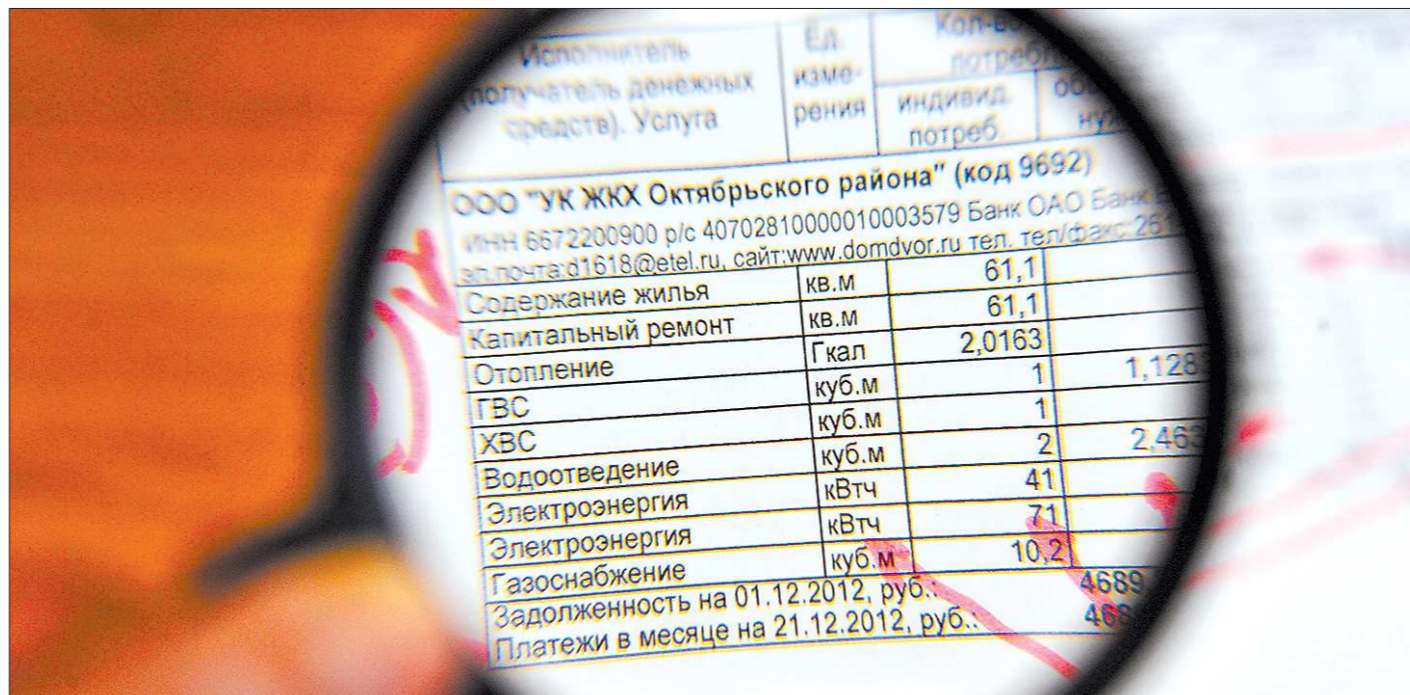
Сейчас вносить средства на капремонт обязаны жильцы лишь тех домов, где на общем собрании было принято соответствующее решение. С января 2014 года платить придется всем