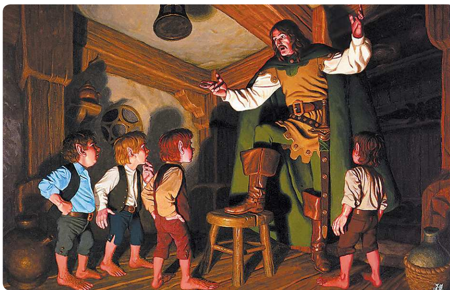
Так представляет себе хоббитов, народ из «Властелина колец» Джона Толкина, один из фанатов