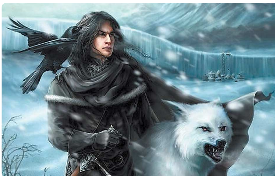
Джон Сноу, один из центральных персонажей серии книг Джорджа Мартина «Песнь льда и огня», со своим лютоволком Призраком

Практически всегда фан-арту сопутствуют фанфики – литературные произведения поклонников на основе любимых книг и фильмов