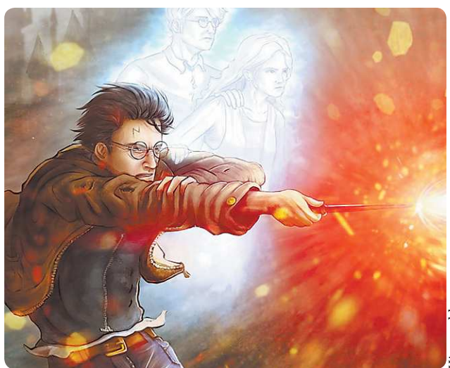
Иллюстрация к книге «Гарри Поттер и Кубок огня» Джоан Роулинг – призраки родителей Гарри появились, чтобы помочь ему сбежать от его главного врага – Волан-де-Морта