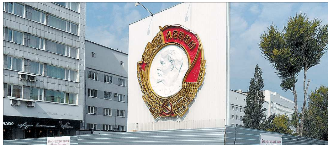
Орден Ленина, демонтированный с екатеринбургской Плотинки, переехал на перекрёсток улиц Свердловла и Челюскинцев, а для его пермского собрата (на снимке) ещё только подыскивают подходящее место