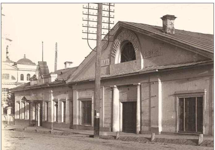
Императорская гранитная фабрика. 1910 год

Здесь, в самом сердце города, проходят все городские праздники. И здесь же — колыбель Екатеринбурга. Неслучайно его называют историческим — вся история города началась именно отсюда, со здания первого завода.