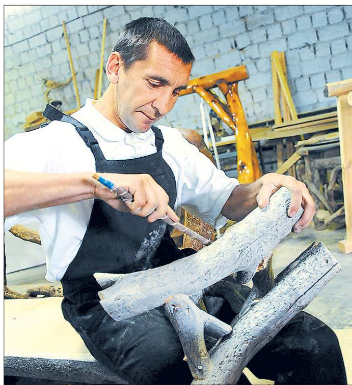
«Мёртвое» дерево получает вторую жизнь в руках мастера. Изделия послужат и порадуют людей ещё не один год