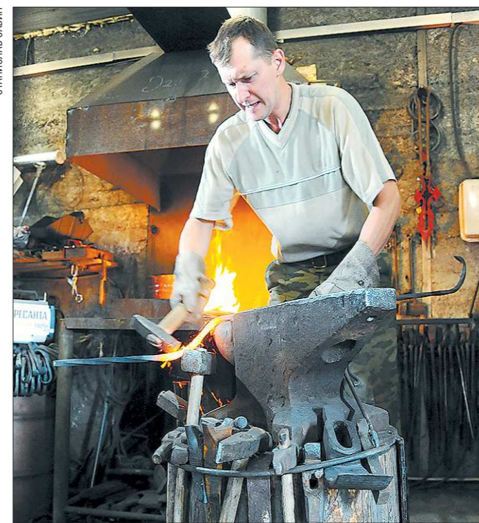
Сложные процессы кузнца выполняет вручную, хотя понятно, что лучше иметь для этого профессиональное оборудование