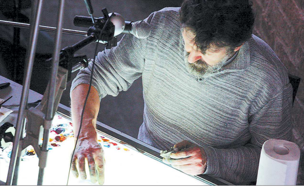
Режиссёр-мультипликатор Александр Петров за работой. «Корову», номинанта на «Оскар», он делал в самом конце восьмидесятых — в «золотые годы» анимации на киностудии.

Книга лежала на высокой подставке. Не плоская, как положено, а с рельефной обложкой. Когда подключили видео-систему, мы увидели откуда ни возьмись взвывшие горы, реки, а потом вдруг картинку сменили названия химических элементов, коими так щедро наделён наш край. Впрочем, назвать издание чисто электронным тоже не получалось. Ведь перелистнуть страницу требовалось чисто механическим путём. А дальше — такое вот сочетание реального и виртуального — перед нами открывались иллюстрации минувшей жизни. Или современного аналога бытлому. Ну да, компьютер уверенно считывал предложенную страницу и в мгновение ока выдавал соответствующий контент. Теперь можно было сопо-