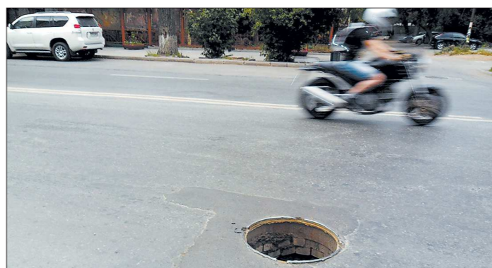
Открытые колодцы напрямую угрожают жизни и здоровью всех участников движения

Ясно одно: крышки с колодезь сняли и унесли не ради озорства, а для наживы, на продажу скупщикам вторсырья. В Нижнем Тагиле металлолом по цене 6–8 рублей за килограмм можно сдать в шести пунктах приёма. Но все эти фирмы имеют лицензию и дорожат ею, так что вряд ли позарятся на явно заимствованные колодезные люки. К тому же на днях полицейские проверили предприни-