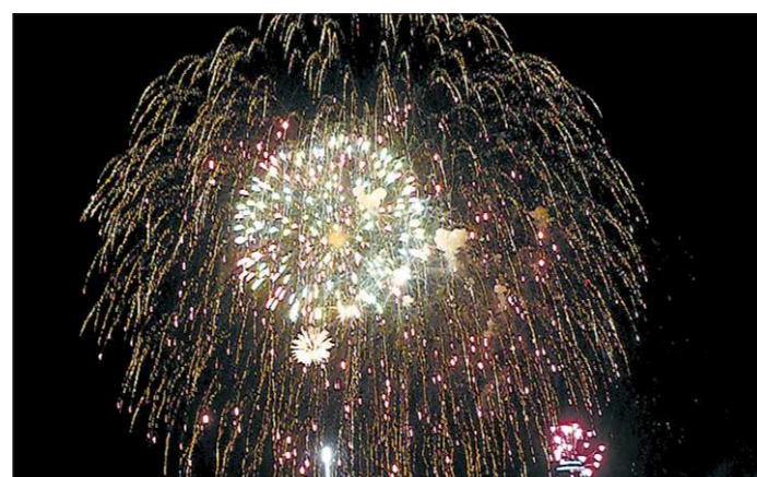
Фейерверк был красив, как никогда — каждый залп зрители сопровождали дружными криками «ура». Тем, кто любовался салютом, стоя на улице в центре города, довелось увидеть даже полёт радиоуправляемого самолёта, расцвеченного яркими огнями