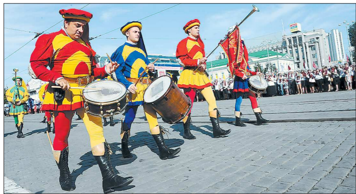
В юбилейный День города многое было со словом «впервые». Например, международный парад духовых оркестров

Екатеринбург отметил 290-й день рождения