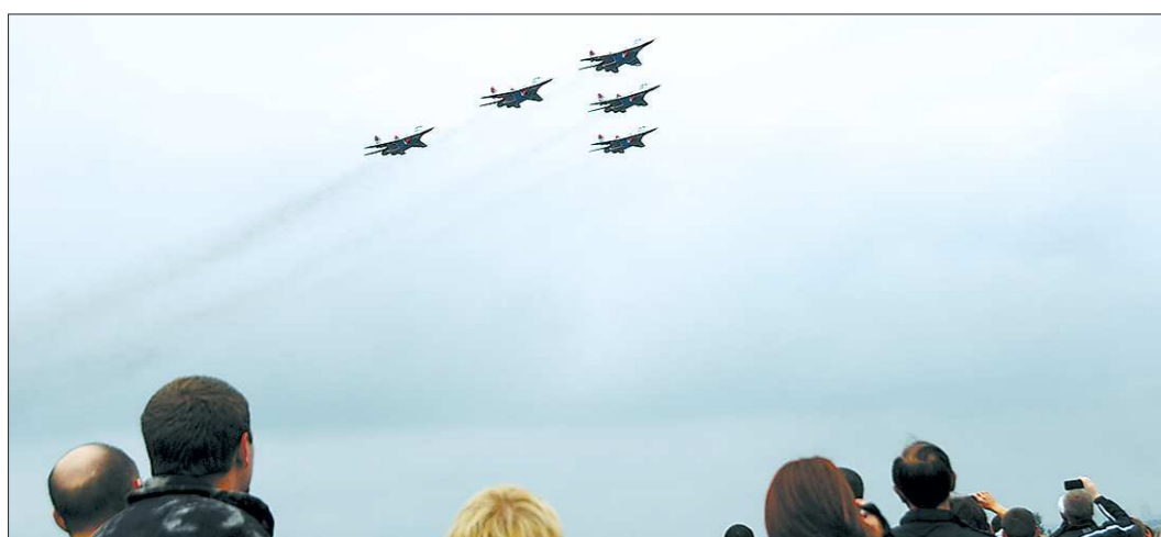
Авиашоу с участием группы «Стрижи» состоялось, несмотря на моросящий дождик. Из-за «низкой облачности» программа полётов была сокращена, но зрителей было по-прежнему много. Несмотря на все усилия организаторов, избежать возникновения пробок не удалось