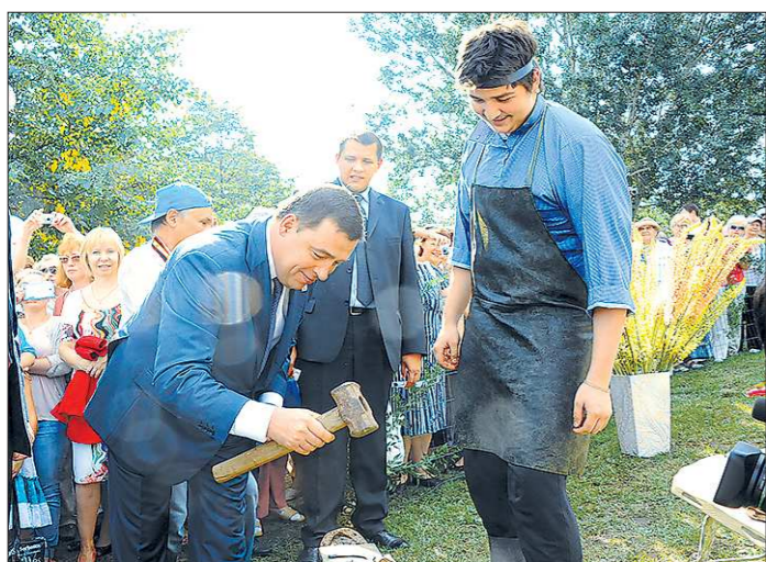
В празднике приняли участие около 800 тысяч уральцев. Губернатор Евгений Куйвашев даже примерил ремесло кузнеца