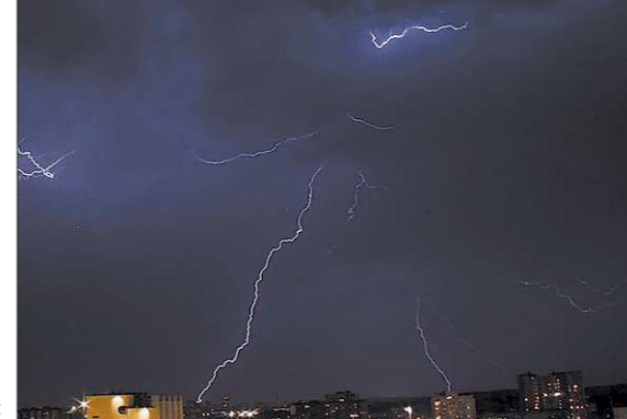
Как только погасли последние искры фейерверка, разразилась небывалая гроза. Некоторые екатеринбуржцы уверяли, что это следствие «разгона туч» перед вечерним концертом. Однако в администрации города заверили, что с погодой не баловались. Гроза была абсолютно «природной». Зато какая эффектная «финальная точка»!