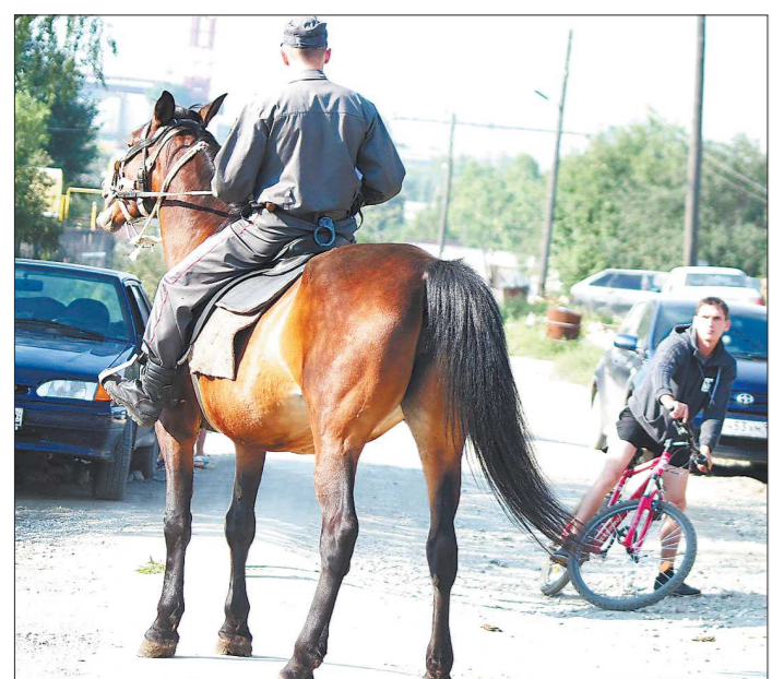
Конное подразделение полиции в Первоуральске — единственное в области. Аналогичное подразделение в Екатеринбурге расформировали в 2009 году. Не потерпелись ли? Конные патрули, возможно, пригодились бы на чемпионате мира по футболу

— Событие очень важное, и не только для Екатеринбурга, но и для всей Свердловской области, потому что это наглядный пример того, как у нас в регионе и в наших муниципалитетах реализуется приоритетный национальный проект «Образование», — отметил Евгений Куйвашев, поздравляя педагогов, родителей и учеников.