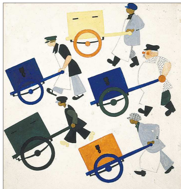
Картинка «Мороженщики» к книге Самуила Маршак «Мороженое»

Владимир Лебедев (1891–1967) — русский советский живописец, признанный мастер плаката, книжной и журнальной иллюстрации, основатель ленинградской школы книжной графики. Народный художник РСФСР, член-корреспондент Академии художеств СССР.