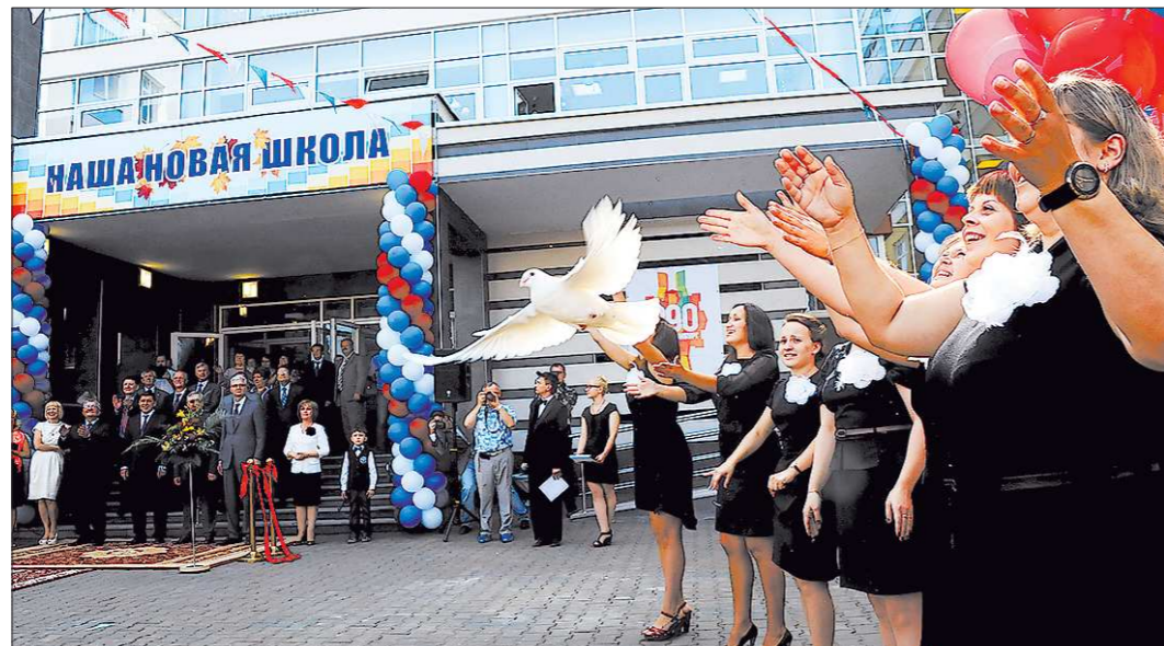
На строительство школы №19 потрачено 677 миллионов рублей, 328 миллионов из них выделены из областного бюджета

В Академическом — тройной праздник. В понедельник утром 350 мальчиков и девочек из этого микрорайона Екатеринбурга отправятся в два новых детских сада, а 1 сентября свои двери для ребят постарше откроет уже вторая в Академическом школа. Вчера поздравить жителей с открытием детских садов №44 и №35 и школы №19 приехали первые лица региона — губернатор Свердловской области Евгений Куйвашев и вице-губернатор — руководитель администрации губернатора Яков Силин.