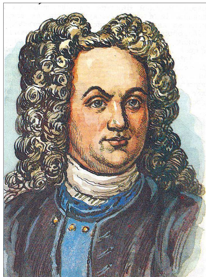
Василий Татищев. В 1721 году он начал строительство города на Исети. Если бы работы не остановили, то основателем был бы он один

О датах, в которые жители столицы Урала праздновали этот день