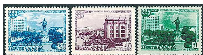
1948 год. Серия марок «225 лет Свердловску»