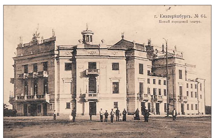
1914 год. Новый городской театр