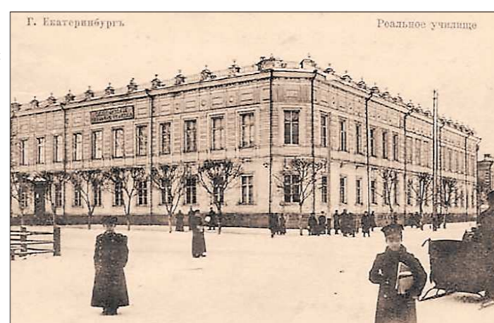
1907 год. Реальное училище