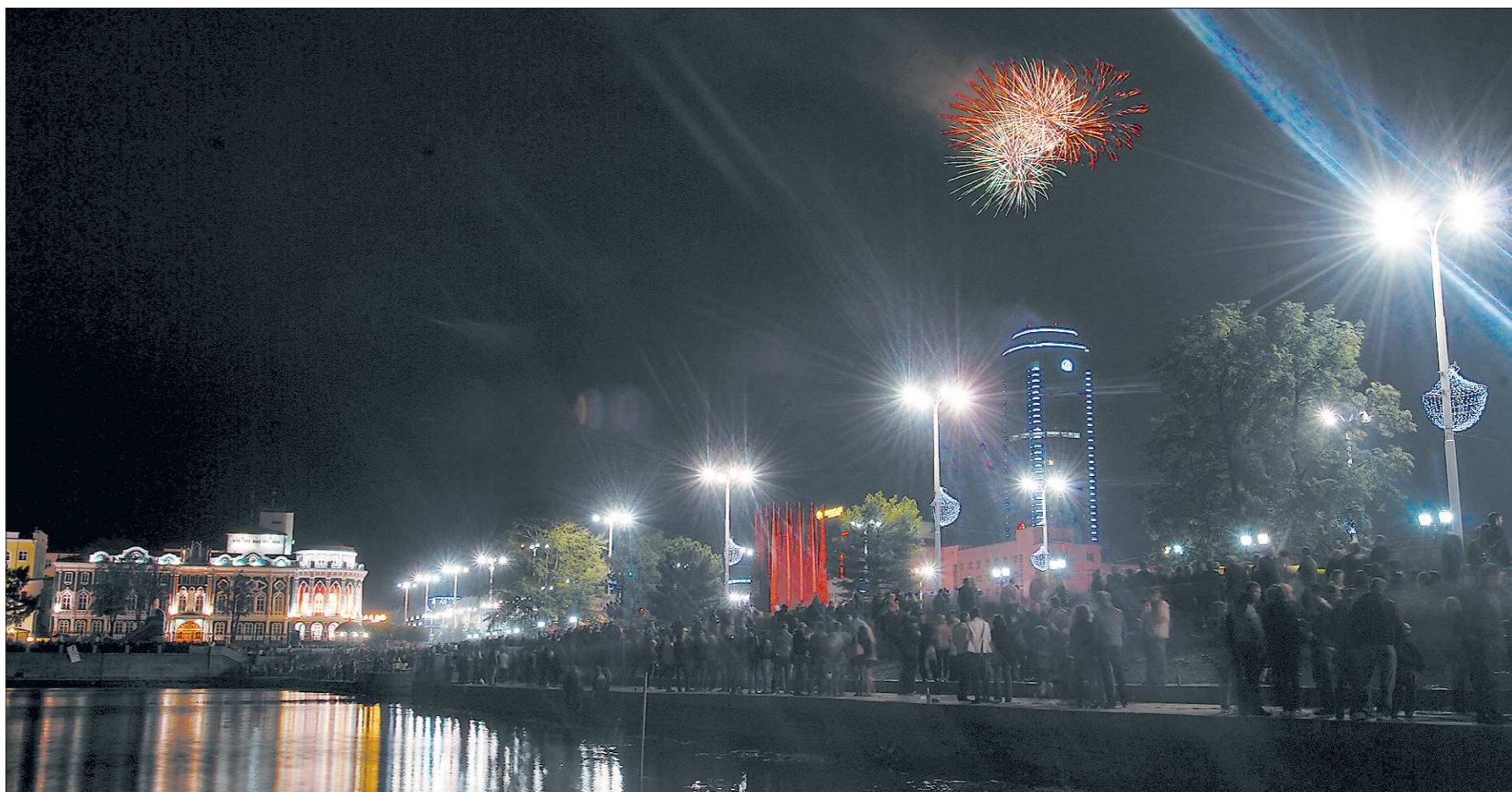
Имя Екатеринбург, которое наш город носит с 1723 года, было возвращено ему в 1991-м, а Свердловском он был 67 лет (с 1924 года)

Так может, они и вовсе не палили, может, не до того было строителям? Палили. Точнее – палила холостым зарядом одна пушка. И даже солдаты Тобольского полка кричали «ура!» и пили вино за казённый счёт. Только случилось это совсем в другой день, а именно – 24 ноября, когда праздновался день святой великомученицы Екатерины, то есть именины новорождённого города. Татищев с де Гениным на том событии, правда, опять же не присутствовали, новопоселенцев вином не угощали, а кре-