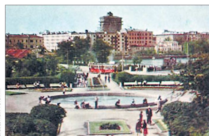
1963 год. Площадь Труда