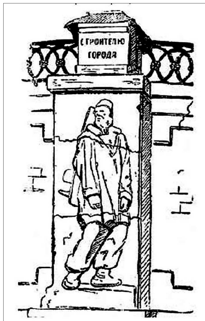
От гипсового монумента первому строителю города, установленного в 1923 году, остался только этот рисунок