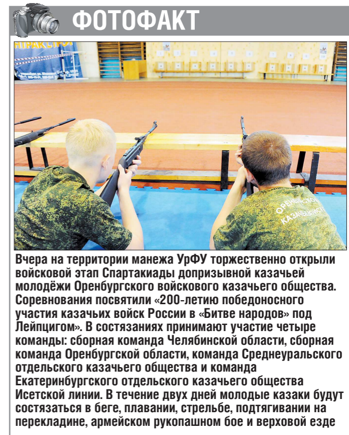
Вчера на территории манежа УрФУ торжественно открыли войсковой этап Спартакиады допризывной казачьей молодёжи Оренбургского войскового казачьего общества. Соревнования посвятили «200-летию победоносного участия казачьих войск России в «Битве народов» под Лейпцигом». В состязании принимают участие четыре команды: сборная команда Челябинской области, сборная команда Оренбургской области, команда Среднеуральского отдельского казачьего общества и команда Екатеринбургского отдельского казачьего общества Исетской линии. В течение двух дней молодые казаки будут состязаться в беге, плавании, стрельбе, подтягивании на перекладине, армейском рукопашном бое и верховой езде