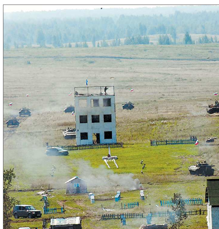
Военные двух стран штурмом взяли условных боевиков, которые, по версии, укрылись в небольшой деревне

сти сегодня ежедневно выходят почти 12 тысяч огнеборцев. Это 6072 сотрудника федеральной противопожарной службы, 2379 специалистов противопожарной службы Свердловской области, 1936 добровольцев из общественных объединений пожарной охраны, 651 сотрудник частной пожарной охраны, 589 — ведомственной, и 63 специалиста из муниципальных.