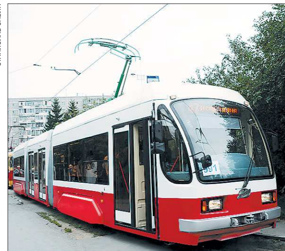
Модель 71-409 — единственная российская разработка полностью низкопольного трамвая, высота пола от уровня рельсов составляет в нём всего 350 миллиметров