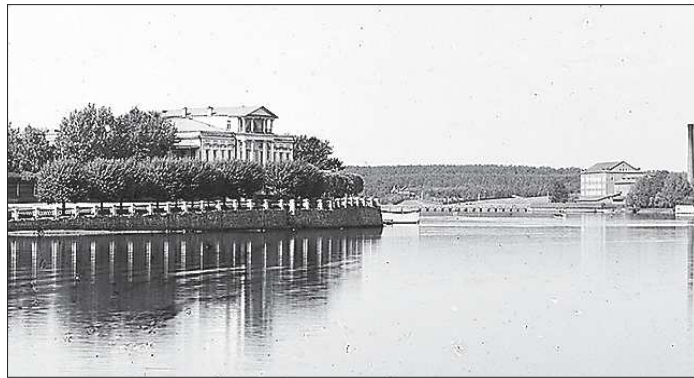
Гимназическая набережная, 1910 год