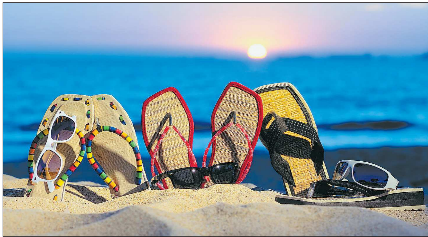
Суммарный доход Турции от ежегодного отдыха там 3,5 миллионов россиян приблизился к трём миллиардам долларов, однако турики всё равно экономят на качестве еды и питья

Второе направление применения нашего изобретения – среда, в которой промышленные роботы трудятся рядом с человеком, например, на сварочных участках или на сборке технических линий. Робот, не имеющий глаз в виде рентгеновского луча, вполне может поранить человека. С нашим же устройством он распознает «коллег».