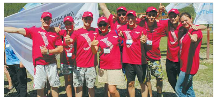
На третьем международном молодёжном промышленном форуме собрались те, кто со студенческих лет включился в инновационные проекты. Нашей команде тоже было чем удивить научную молодёжь

щие в отеле Джаканда, – 24. Турки пытаются найти источник инфекции, но пока возбудитель не обнаружен. Между тем главный санврач России Геннадий Онищенко предупредил, что может принять решение о запрете выезда россиян в «Османскую империю» на отдых, если там продолжат нарушать санитарные нормы и правила гигиены.