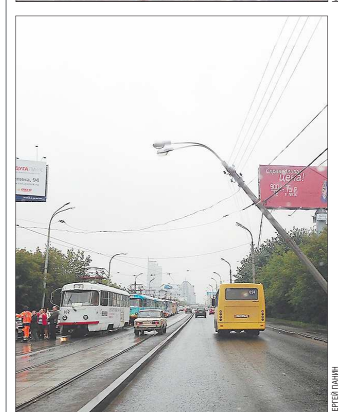
На Макаровском мосту в Екатеринбурге экскаваторщик, проводивший земляные работы, обрушил бетонный столб, который проводами потянул за собой второй такой же столб – на противоположном конце дороги, который упал на высоковольтные провода. Обрушение столбов, в том числе бетонных, в Екатеринбурге случались (в последний раз – в марте нынешнего года), но вот падение двух сразу – своеобразный рекорд. Впрочем, люди при аварии не пострадали, а её последствия очень быстро устранили дорожные службы