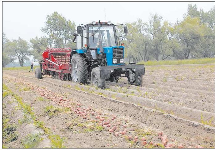
Сейчас картофелеводы мечтают о том, чтобы и в период уборки погода была так же к ним благосклонна