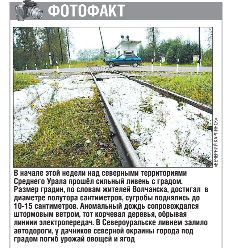
В начале этой недели над северными территориями Среднего Урала прошёл сильный ливень с градом. Размер градин, по словам жителей Волчанска, достигал в диаметре полутора сантиметров, сугробы поднялись до 10-15 сантиметров. Аномальный дождь сопровождался штормовым ветром, тот корчевал деревья, обрывая линии электропередач. В Североуральске ливнем залило автодороги, у дачников северной окраины города под градом погиб урожай овощей и ягод