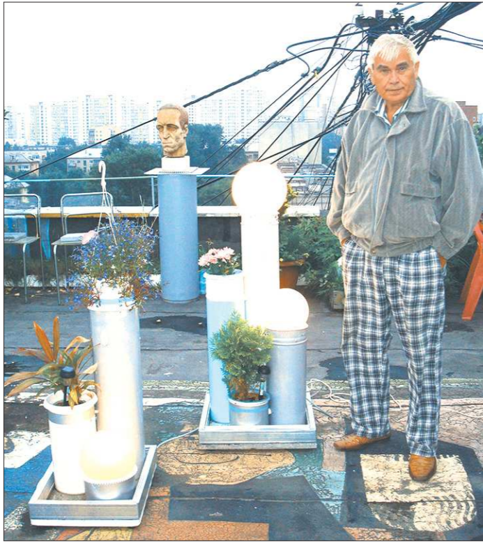
Площадь цветника, который расположен по улице Сурикова, около 400 квадратных метров