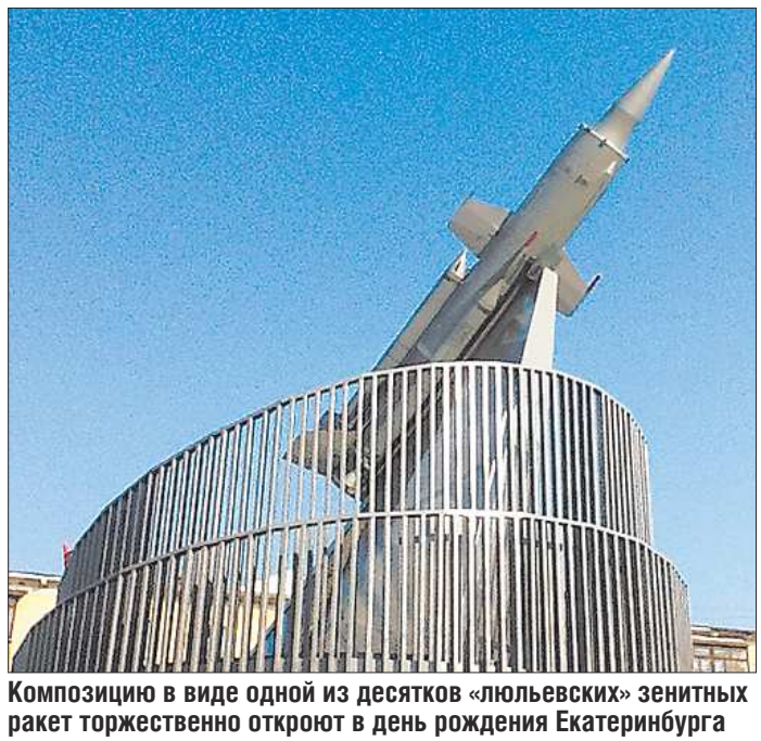
Композицию в виде одной из десятков «люльевских» зенитных ракет торжественно откроют в день рождения Екатеринбурга

настали другие, полки в магазинах ломаются от продуктов, но возмещать о наступлении эры изобилия и всеобщего благоденствия пока преждевременно. Вряд ли в городе есть семья, в которой специально покупают торты для того, чтобы упрямиться в меткости. Да и просто — жалко продукты.