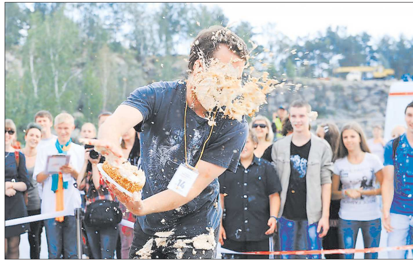
Торты, по утверждению сотрудников «Радуги», были закуплены специально для этого конкурса. «Все они были свежие, не просроченные», — особо подчеркнули в ТРЦ. Впрочем, всё равно большая часть бисквитного месива осталась лежать на земле

Два года назад памятник Льву Люльеву из бронзы и гранита был установлен и открыт в Киеве, на проспекте Победы. На его постаменте начертано по-украински: «Выдающемуся конструктору артиллерийского и ракетно-зенитного оружия, студенту Киевской политехники 1927–1931 от преподавателей и студентов КПИ. 2011 г.»