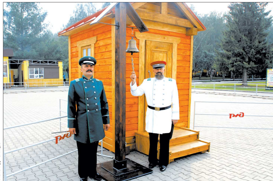
Начать коренную реконструкцию Свердловской детской железной дороги губернатор Евгений Куйвашев распорядился ещё 2 июля при посещении ЦПКИО им. Маяковского

Если работа по строительству высокоскоростной железной дороги продолжится так же бодро, как и началась, то, быть может, на суперско-