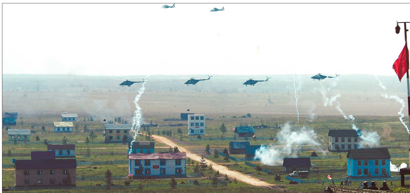
На антитеррористических учениях в Чебаркуле российские и китайские военнослужащие отрабатывали совместные действия по освобождению жителей захваченного террористами посёлка