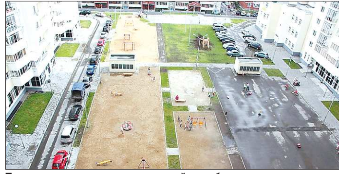
Полупустая площадка у новостройки-победителя на Соболева, 19, является, скорее всего, «особенностью проекта»: двор расположен на крыше подземного паркинга