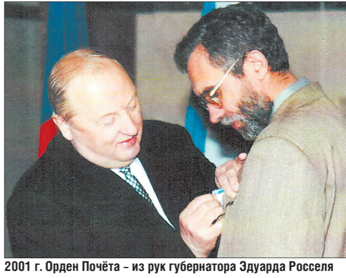
2001 г. Орден Почёта – из рук губернатора Эдуарда Росселя