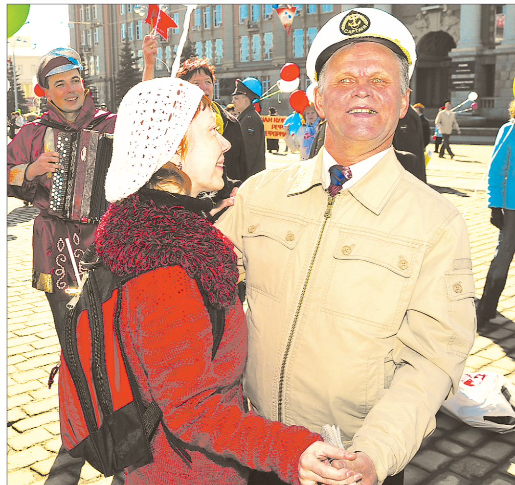
Пенсионеры и пожилые — это не одно и то же. Среди первых немало 50- и даже 40-летних