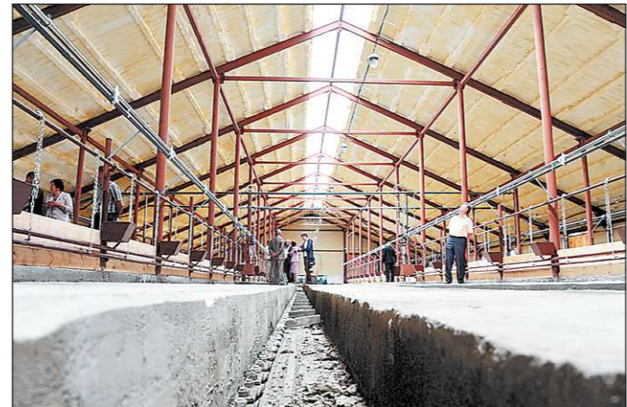
Подрядчики обещали сдать объект «под ключ» за три месяца. Правда, как говорят в хозяйстве, «чуда не произошло, управились за шесть»