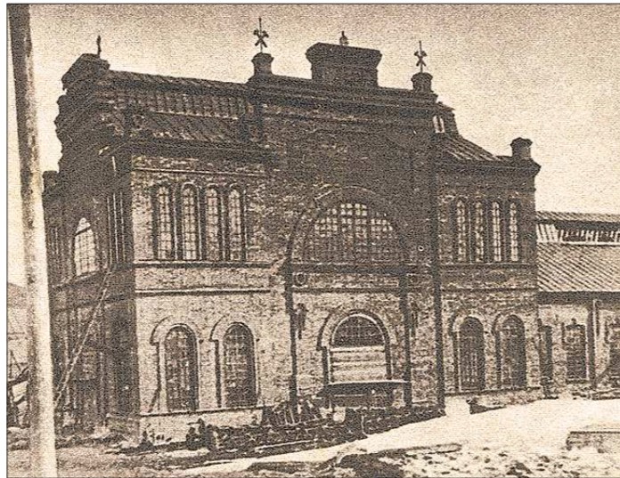
Здание косного цеха в 1916 году. Оно и сейчас внешне практически не изменилось