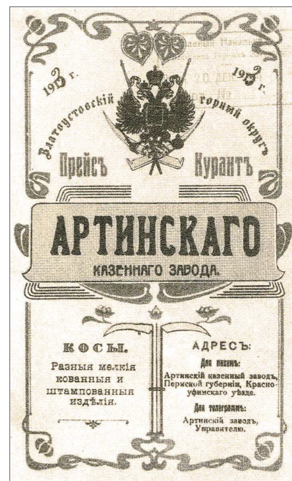
Прейскурант на изделия завода 1913 года

Оба этих производства в Арты существуют по сей день, а артинская коса стала не только символом этого посёлка, но и прославилась его единственным в России турниром косарей, который проходит в Арты с 2011 года.