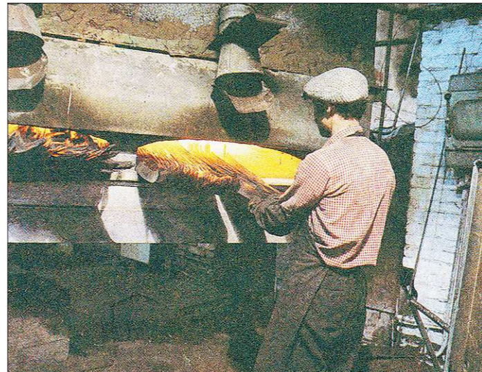
Нагрев косных заготовок в печах перед ковкой в 80-х годах прошлого века. Этот процесс тоже не поменялся с тех пор