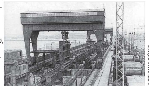
Поднятие затвора водослива козловым краном. Камская ГЭС, 1955 год

Индустриальному Свердловску не хватало электроэнергии всегда. Например, ещё в 1931 году город вынужденно начал пользоваться током Челябинской ГРЭС, а в годы Великой Отечественной войны, когда в Свердловске и Свердловскую область были эвакуированы многие предприятия, эта нагрузка многократно возросла. Война окончилась, а предприятия остались, и за пять послевоенных лет нагрузка на электростанцию Урала выросла почти на 50 процентов. В 1951 году нуждающемуся Свердловску начала давать ток построенная годом раньше Нижне-Туринская ГРЭС, а в 1954-м начала строиться линия высоковольтной ЛЭП Свердловск-Пермь, по которой пошёл из Перми ток Камской ГЭС, где только-только был пущен первый из гидроагрегатов. КСТАТИ. Работы по строительству Камского гидроузла велись грандиозные. Ещё до постройки электростанции развернулись обширные подготовительные работы: строились линии электропередачи и подстанции, автомобильные и железные дороги, лесоматериал и бетонный завод. Из сотен городов Советского Союза на строительство ГЭС ехали как специалисты, так и добровольцы-романтики. Она и сегодня остаётся одной из самых мощных ГЭС России.