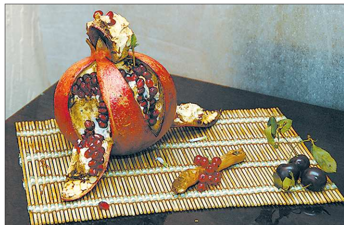
Сладости не только вкусные, но и красивые. Стенды с ними оформлены, как настоящие натюрморты