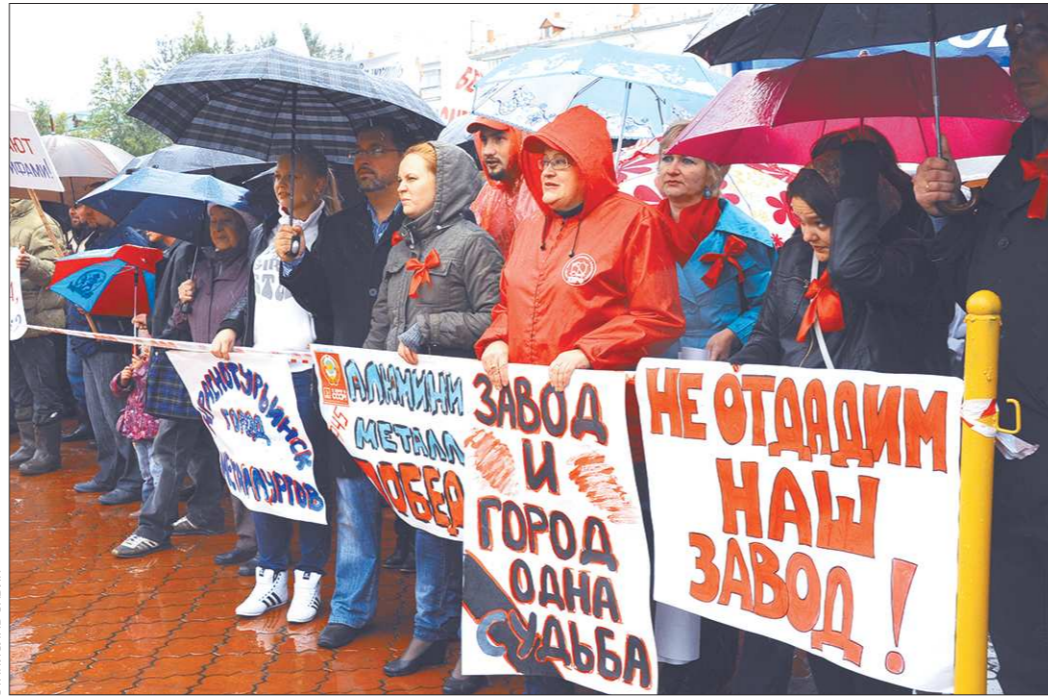
Тучи над БАЗом сгущаются не впервые. «ОГ» не раз посвящала первую полосу этой теме

— В условиях снижения цен на алюминий компания рассматривает различные варианты дальнейшей работы своих предприятий. Никаких конкретных решений о снижении объёмов производства,