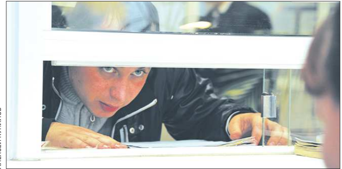
Приведётся ли перед обращением в регпалату идти к нотариусу? Ответ получим после рассмотрения проекта нового закона о нотариате

— В июле этого года у нас резко повысилось количество смертей на рабочих местах — от инфаркта миокарда, инсульта и других заболеваний.