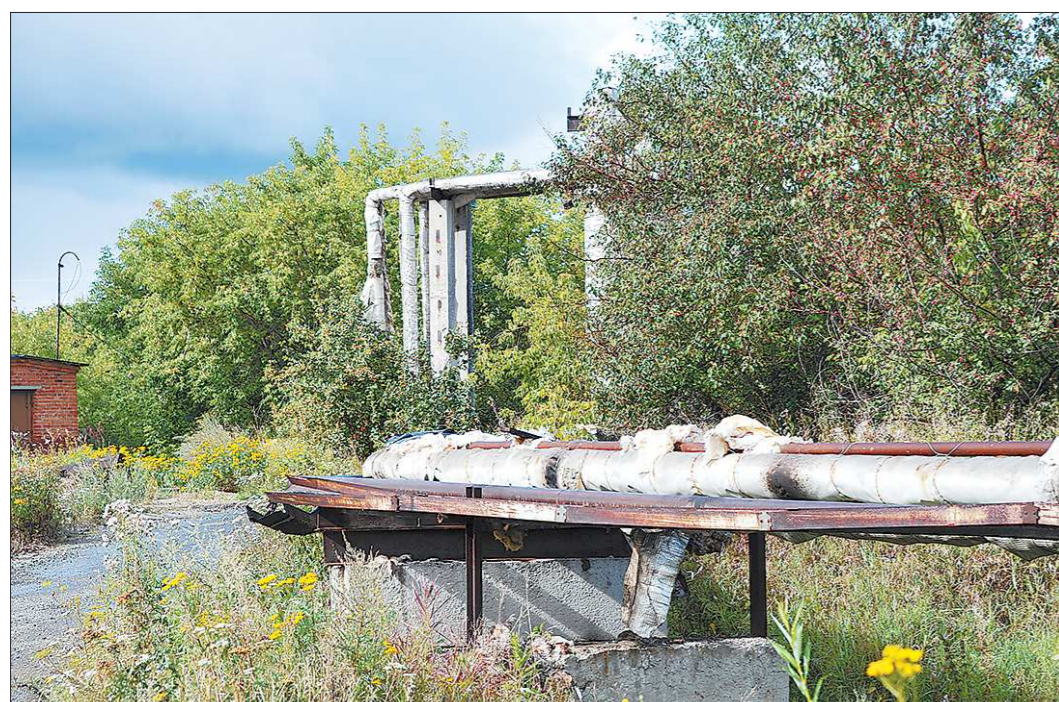
Наибольшие потери вот от таких «раздетых», без теплоизоляции труб

Начало материалов из серии «Анатомия квитанции» читайте в № 334-337 от 17 июля и в № 345-346 от 24 июля 2013 года. Материалы о квитанциях на оплату жилищно-коммунальных услуг выходят в «Областной газете» каждую среду и субботу.