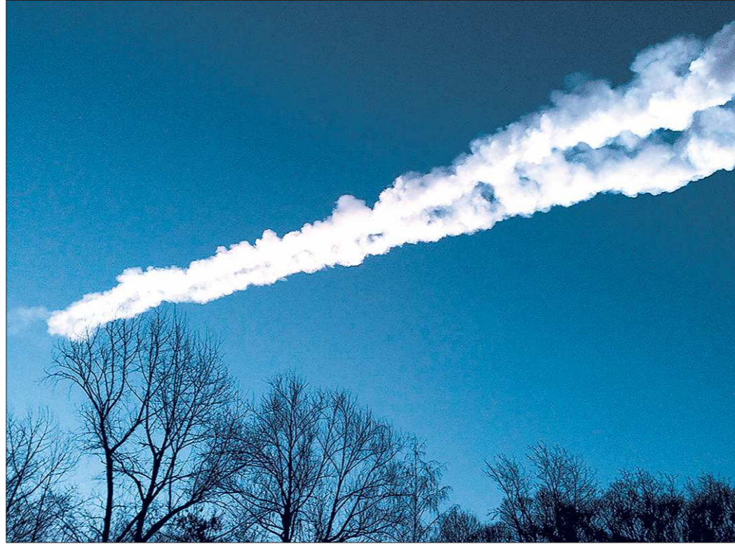
Болид в небе отчётливо был виден на территории Свердловской области

– Видели большую поляну. Предполагают, что на дне Чебаркуля лежит обломок весом 20 или 30 килограммов. Попытались его достать, но оказалось, что там, на глубине, донный ил