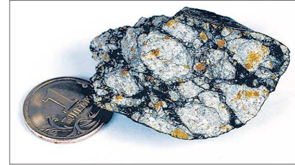
Полированный срез обломка метеорита

и не обнаружили, метеоритного вещества тоже не найдено, да и взрыв был в воздухе такой, что от взрывной волны деревья были повалены на площади около двух тысяч квадратных километров... Но именно падение Челябинского метеорита доказало, что всё это возможно и с обычным метеоритом: там тоже была мощная ударная волна и никаких кратеров также не найдено... Что же касается метеоритного вещества, которого в случае с Тунгусским метеоритом так и не нашли, то это теперь тоже можно объяснить: состав метеоритов