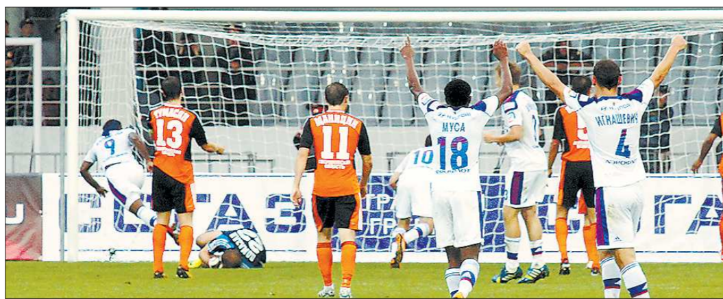
Любопытный факт, на который, кажется, никто не обратил внимания. Гол в ворота «Урала», забитый 17 июля на 86-й минуте матча с ЦСКА нападающим армейцев Вагнером Лавом, стал последним голом бразильца в чемпионатах России. В следующем туре «Локомотив» он не забивал, а затем отправился в китайский клуб «Шаньдун Лунзэн» – в Поднебесной ему предложили заоблачную зарплату. С 2004 года (с двумя перерывами) Вагнер Лав сыграл за ЦСКА 259 матчей, забил 124 мяча (рекорд среди иностранцев в российском футболе). Теоретически бразилец может и третий раз вернуться в Россию и забить ещё. Но на сегодняшний день последний гол одного из самых ярких форвардов отечественного чемпионата забит на Центральном стадионе Екатеринбурга (на фото)