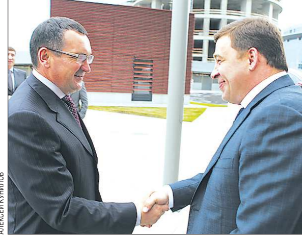
Федеральный министр Николай Фёдоров (на снимке слева) и губернатор Евгений Куйвашев обсудили программы по развитию молочного животноводства и увеличению производства молока в Свердловской области

торые имеют сверхнормативный срок эксплуатации, что приводит к нарушениям технологических процессов и снижению качества молока. Старые стены и старые технологии не в состоянии обеспечить полноценность молочных рек. Да и не у всех, кто вложился в этот бизнес с нуля, дела идут блестяще.