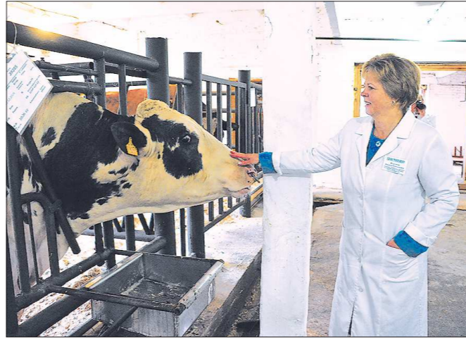
В 2013 году на поддержку племенного животноводства из областного бюджета выделено свыше 96 миллионов рублей. В области успешно работают 40 племенных заводов по разведению крупного рогатого скота