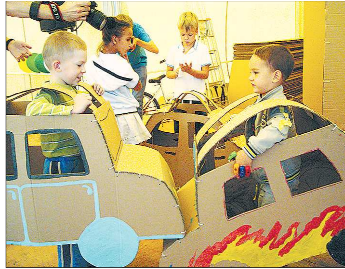
А этот конкурс пафосно назвали перформансом «Картония». Вообще-то детские поделки из картона — это прекрасное, но старое, как мир, занятие...

здесь подольше. А какой-нибудь журнал в городе у вас есть? Первоуральцы думали, что это юмор, и весело смеялись, хотя лектор говорил серьёзно.