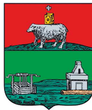
Герб 1783 года