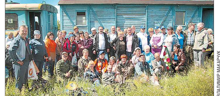
Большинство бывших берёзовчан приехали на специально заказанном поезде из двух вагонов, некоторые «по старой памяти» добирались по узкоколейке на сёмёных дрезинах

ГОСУДАРСТВЕННОЕ БЮДЖЕТНОЕ УЧРЕЖДЕНИЕ СВЕРДЛОВСКОЙ ОБЛАСТИ «РЕДАКЦИЯ ГАЗЕТЫ "ОБЛАСТНАЯ ГАЗЕТА"». ОБЩЕСТВЕННО-ПОЛИТИЧЕСКОЕ ИЗДАНИЕ