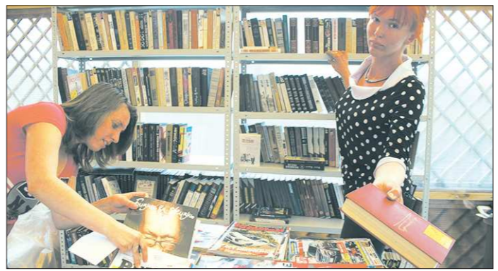
Если читатель не идёт в библиотеку, библиотека идёт к читателю. «Белинка» открыла читальный зал в парке имени Маяковского – можно почитать на свежем воздухе

* Это такие кафе, где платишь не за еду или услугу, а за время. Например, минута стоит один рубль. В таких кафе проводятся тренинги, дискуссии, кино клубы, поэтические вечера