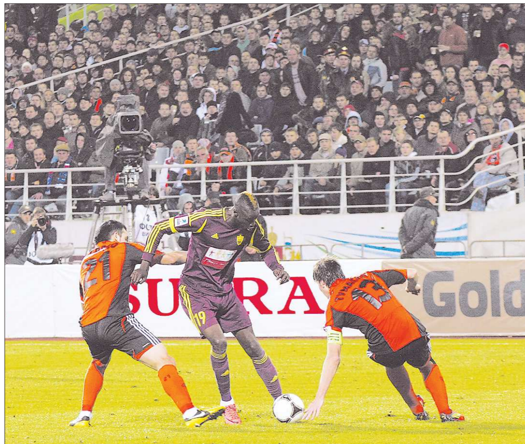
Полные трибуны, лучшие команды страны – теперь футбол в Екатеринбурге будет таким регулярно, а не от случая к случаю

По поводу посещаемости домашних матчей «Урала» – отдельная и, пожалуй, можно сказать, болезненная для руководства екатеринбургского клуба тема. Заполняя до отказа трибуны Центрального стадиона на матчах молодеж-