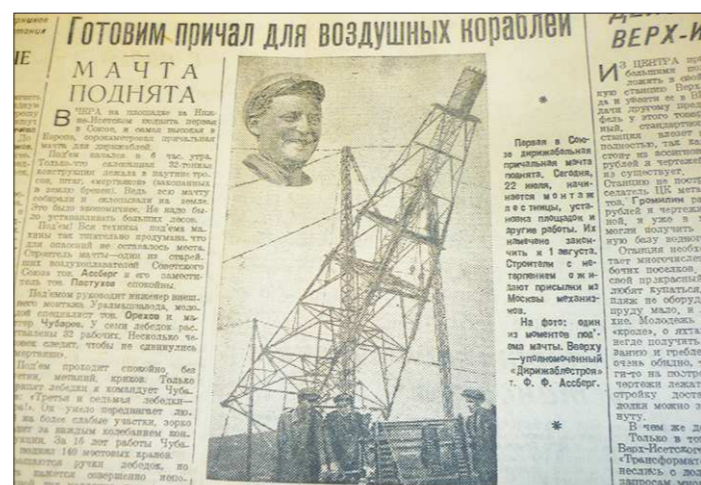
В музее истории УЗТМ мы не обнаружили сведений об этом удивительном событии, а в газете «Уральский рабочий» за 21 июля 1935 года помимо репортажа о монтаже мачты нашли перепечатку из газеты «Правда» об успешных испытаниях дирижабля «В-6» — того самого, что прилетал в Свердловск в сентябре 1937 года

Пожалуй, волна революций в арабском мире дискредитировала себя ещё раньше. Когда «революционеры» в Ливии под объективами телекамер зверски расправлялись с Муамаром Каддафи, а позднее — с послом США в этой стране. Тягостное впечатление на мировую общественность уже не первый год производит действия «повстанцев» в Сирии, — стране, выбранной на роль очередной жертвы «триумфального шествия демократии».