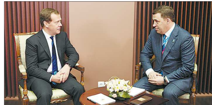
Председатель правительства России Дмитрий Медведев приезжает на Иннопром второй год подряд, подтверждая своим присутствием статус Екатеринбурга как центра крупных российских и международных событий

Губернатор Свердловской области отметил, что выставка проводится уже в четвёртый раз и привлекает всё больше компаний, вносит существенный вклад в развитие промышленного сектора региона.