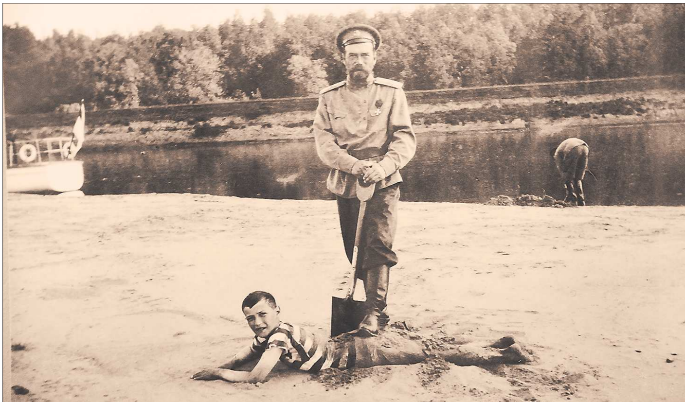
После мартовских событий 1917 года Николай II с семьёй жил вначале в Царском Селе, а потом в Тобольске (на фото). В эти дни Романовы ещё надеялись на лучшее