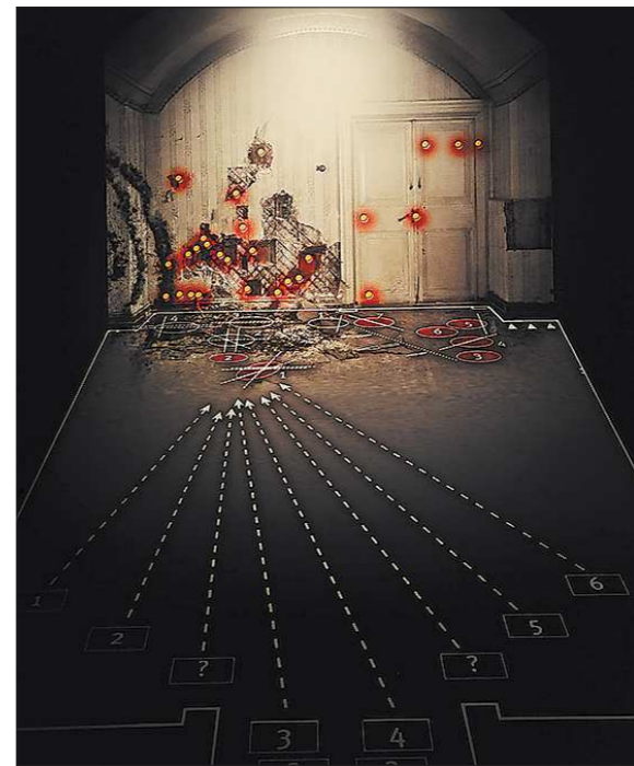
Один из центральных экспонатов выставки – реконструкция преступления в Ипатьевском доме. По характеру огнестрельных ранений и следам пуль следователи сделали вывод, что в момент убийства сестры и мать пытались закрыть собой царевича Алексея

Нам бережнее надо относиться к истории своей страны, ведь строительство будущего невозможно без осознания ошибок прошлого.