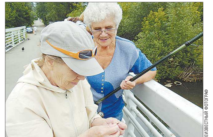
Самыми удачливыми в конкурсе стали женщины, хотя сначала не у всех получалось насадить наживку на крючок