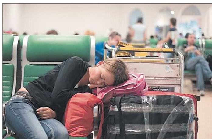
По вине турагентства «Розовый пеликан» десятки уральцев, заплативших за отдых, так никуда и не улетели

На сегодня в очереди в дошкольные учреждения стоят около 18 тысяч детей от трёх до семи лет, из них 7,5 тысячи – жители областного центра. Намечается, что к 2016 году свердловчане забудут о дефиците мест в детских садах.