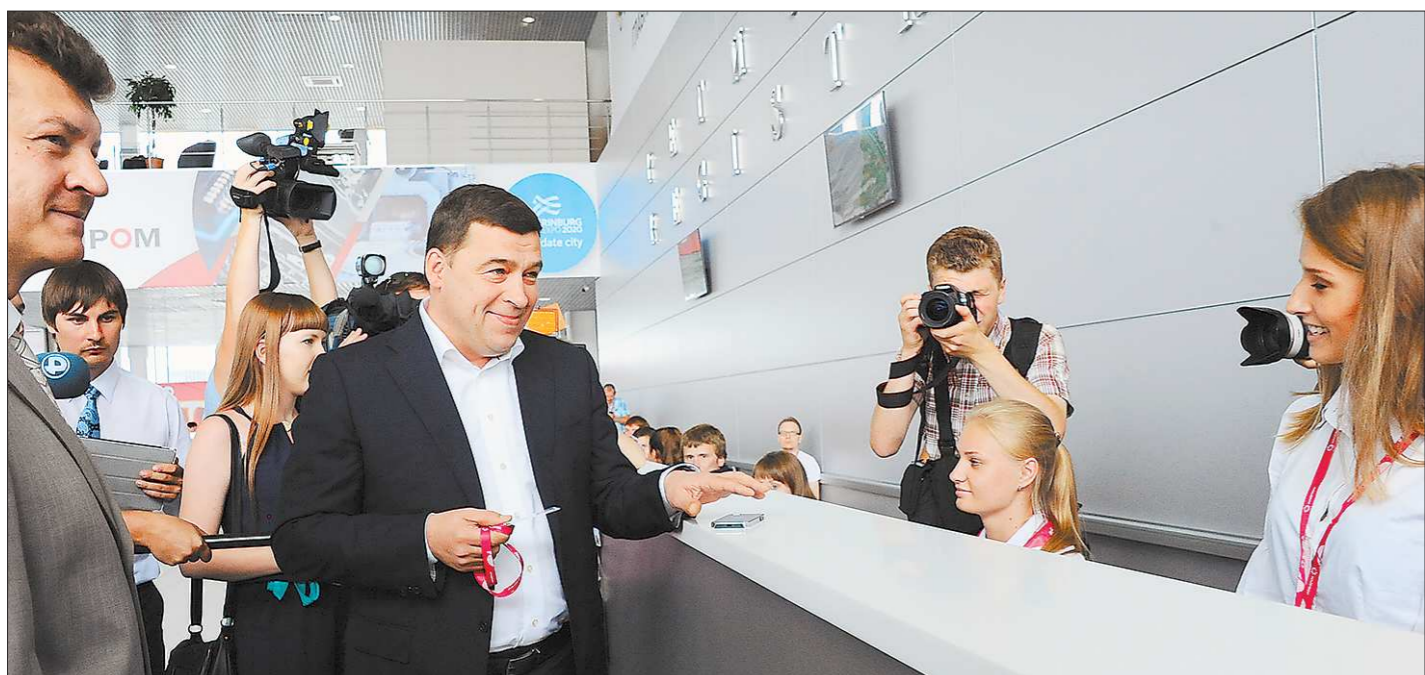
Бейдж, дающий право беспрепятственного посещения экспозиций в дни работы Иннопрома-2013, губернатор Евгений Куйвашев получил вчера вместе с аккредитованными на выставку журналистами