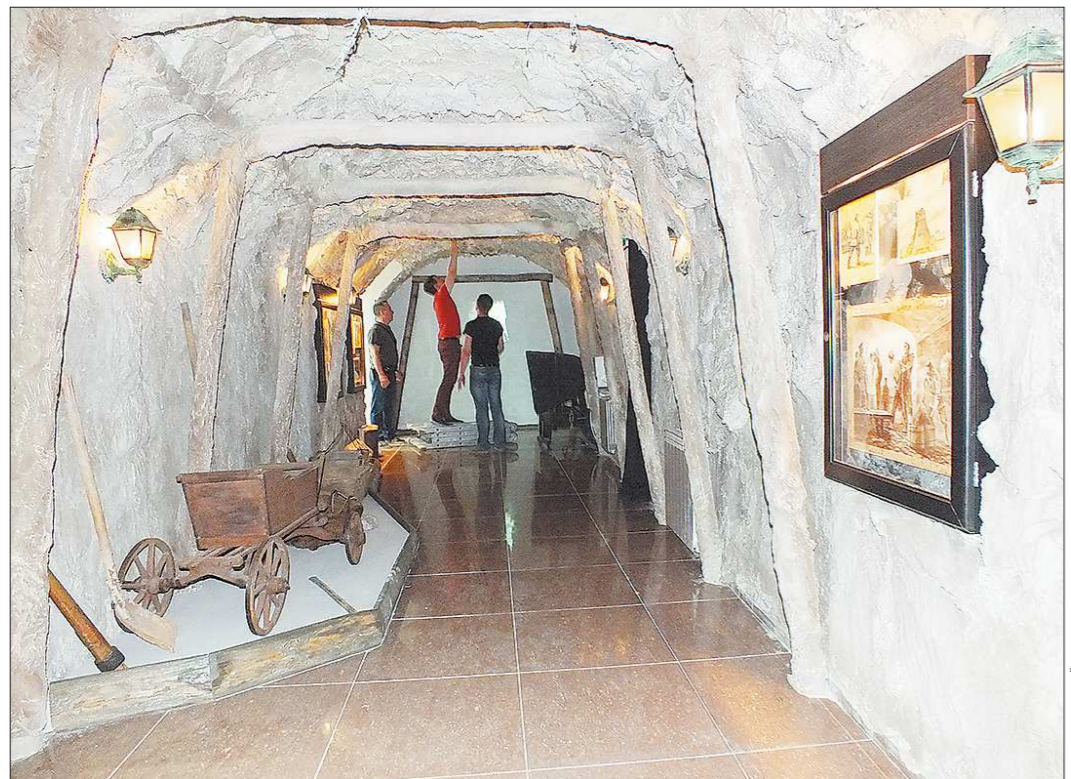
В Берёзовском после реконструкции открылся музей золота, который был основан ещё в пятидесятых годах. Четыре года из-за обрушившейся крыши музей не работал, но теперь снова радует посетителей