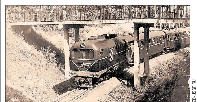
70-е годы. Поезд «Юный уралец» на перегоне «Центральная—Солнечная»